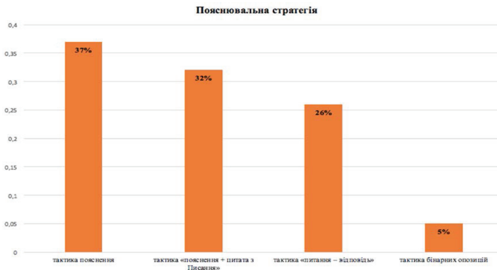
Рис. 1. Кількісне відношення тактик пояснювальної стратегії

Аналіз реалізації загальних стратегій встановив ключові функції стратегій, основні тактики їх реалізації, а також лексичні прийоми, синтаксичні схеми, до яких традиційно звертається проповідник. Сім загальних стратегій